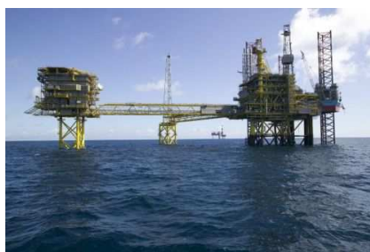
OIL & GAS