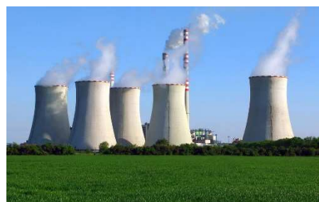
ENERGIE / NUCLEAIRE